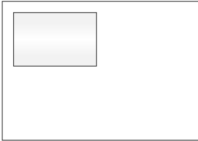
FORMATBEISPIEL. 1/4 SEITE