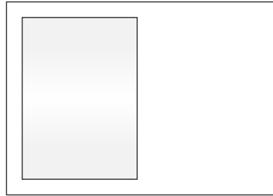
FORMATBEISPIEL. 1/2 SEITE